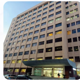
技尔应用技术中心